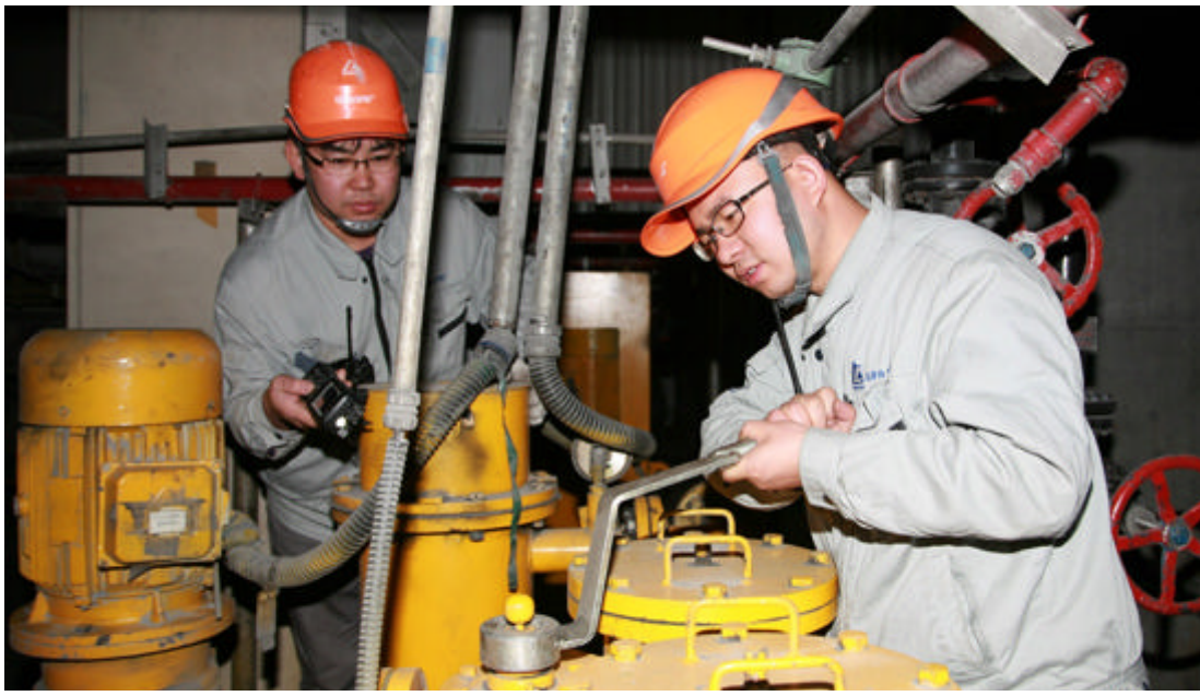
▲图为马莲台发电厂员工在检测设备运行情况。

本报讯 今年以来,中铝宁夏能源集团马莲台发电厂通过不断强化内部管理,各项生产经营指标再创新高。截至11月底,该厂实现利润1.1亿元,提前一个月完成年度利润目标。该厂通过技术改造每千瓦时降低供电煤耗1.5克,两台机组均进入全国机组竞赛300兆瓦机组先进行列,主要能耗指标达到全国同类型机组先进水平。 据了解,今年该地区大用户直供电造成平均电价下降0.5分/千瓦时,9月份电价下调0.9分/千瓦时,两项合并,该厂共减少收入近两千万。为了尽快补齐缺口,该厂从优化运行、科技创新、节能降耗、对标管理、燃煤掺烧、修旧利废上下功夫,通过多种措施、平台、载体和项目提升质量增加效益,各项“规定动作”和“自选动作”齐头并进,管理提升与技术培训并举,创新驱动与运营转型互补,对标先进与检修改造协同,确保了机组安全高效运行,有效弥补了环保成本上升和外部市场用电量趋缓的影响。