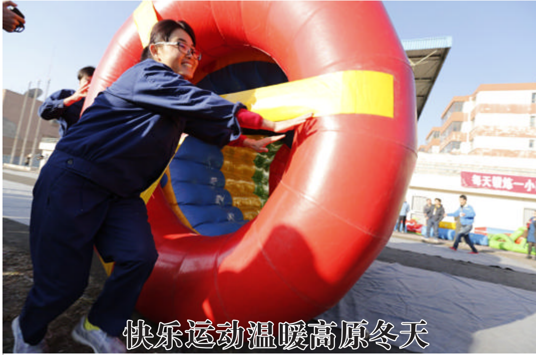
快乐运动温暖高原冬天

▲近日，中国铝业青海分公司举行第六届职工趣味运动会，来自该公司的16支代表队600多名选手参加了活动，在动感五环、旱地龙舟等8个项目上展开了竞技。图为动感五环项目比赛现场。