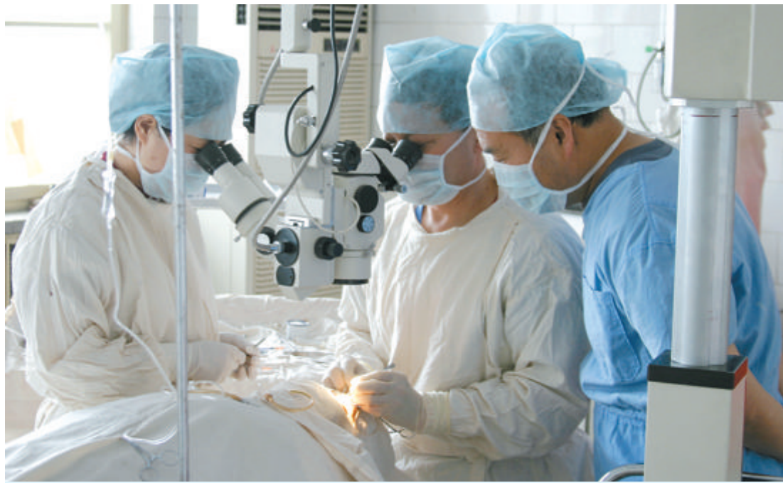
▲兰州连城铝业有限责任公司兰州连铝医院自10月份进行混合所有制改制以来,灵活开放的管理体制机制增强了医院内生活力。该院采取门诊免费挂号、免费接送30公里以内病人以及增加风湿骨病科室等措施,使该院每天门诊、住院病人数量达到改制前4倍以上。图为该院医务人员借助先进的医疗设备为患者做眼科手术。